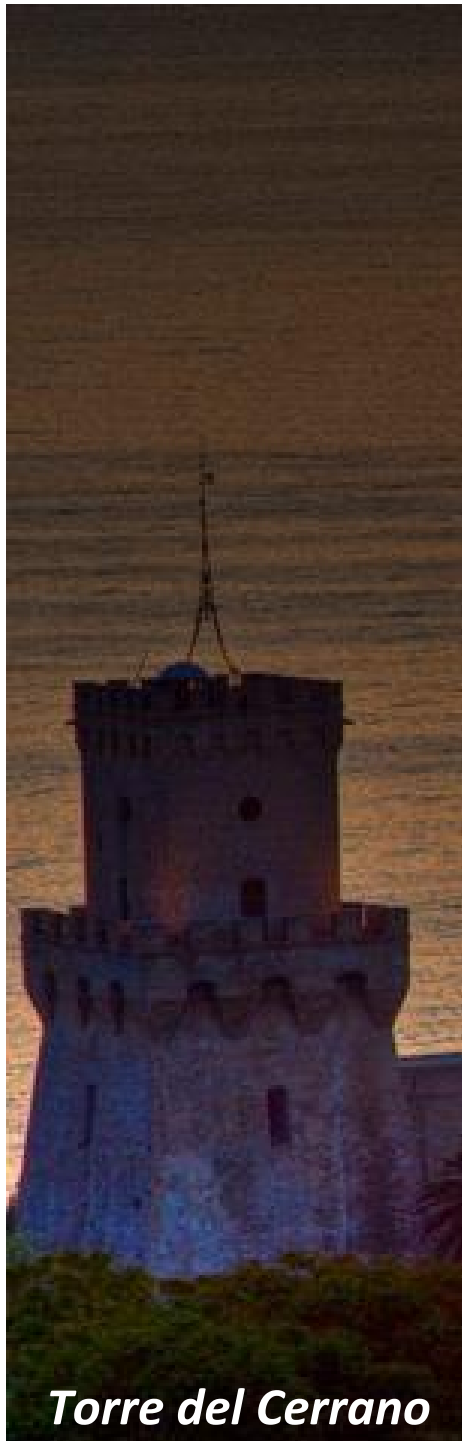
Torre del Cerrano